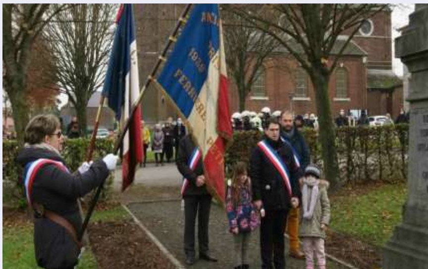
Dépôt de gerbe au monument aux morts