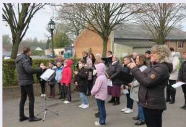
Mélodie Chorale accompagnée des enfants de l'école interprètent la Marseillaise