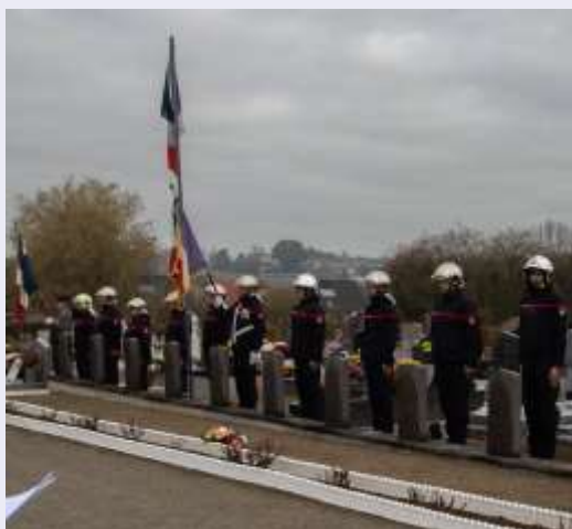
Dépôt de gerbes sur les tombes des soldats morts pour la France